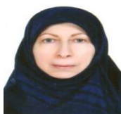
سرکار خانم دکتر پروین میرمیران دانشمندان برگزیده دهه اخیر، سال های 1390 الی 1402