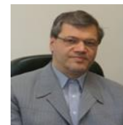
جناب آقای دکتر باقر لاریجانی